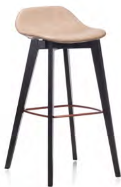
BARCHAIR H75 — C0518